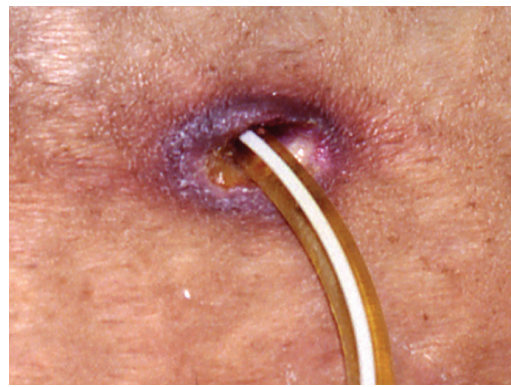
Un point de sortie infecté

La zone entourant un point de sortie infecté peut être rouge, douloureuse, enflée et présenter des suintements.