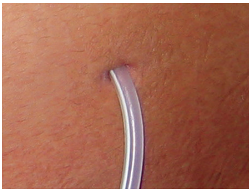
Un point de sortie sain

La zone entourant un point de sortie sain est de couleur normale. Il ne devrait pas présenter de suintement.